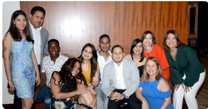
COLABORADORES DE LA SIV DURANTE LA ACTIVIDAD DEL ANIVERSARIO