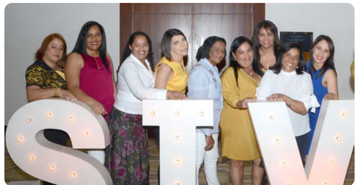
COLABORADORES DE LA SIV DURANTE LA ACTIVIDAD DEL ANIVERSARIO