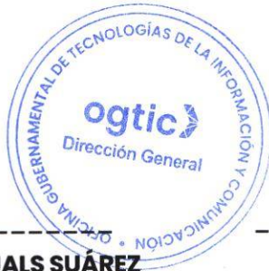
BARTOLOMÉ YAQUE PUJALS SUÁREZ