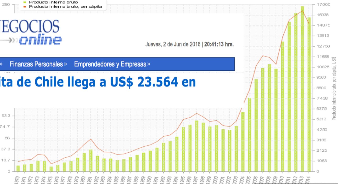
Producto interno bruto, precios corrientes; Chile; 1970-2014