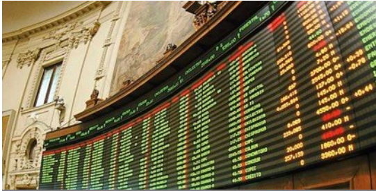
Mercado de Capitales