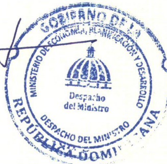
Pável Isa Contreras Ministro